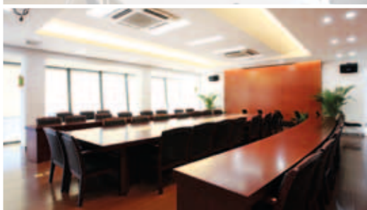
Cassettes encastrées en salle de réunion