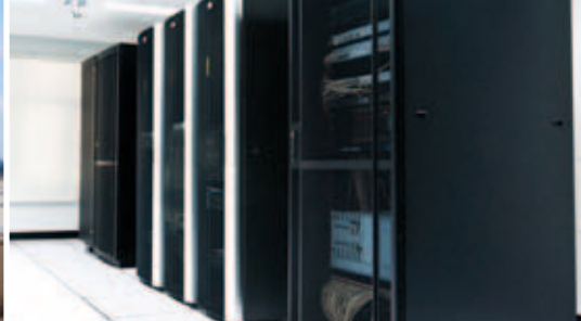
Récupération de chaleur en salle serveurs