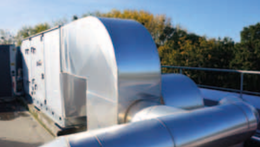
Centrale de traitement d'air