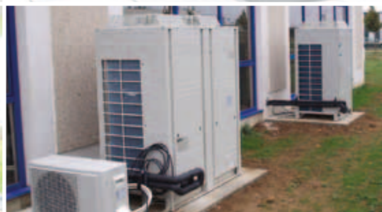
Groupes de condensation extérieurs