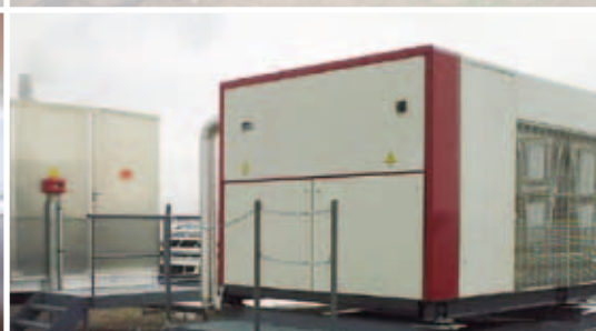
Chaufferie et groupe d'eau glacée en terrasse